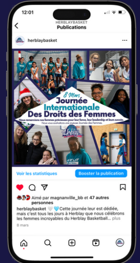
Promotion des femmes dans le monde du sport