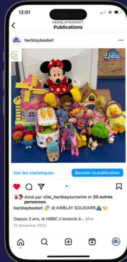
Collecte de jouets pour Century 21