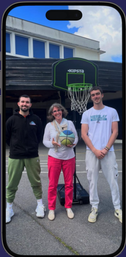
Opération Basket Ecole