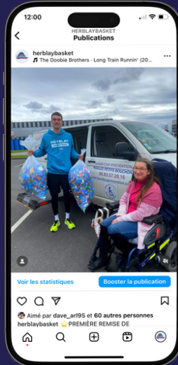
Collecte de bouchon